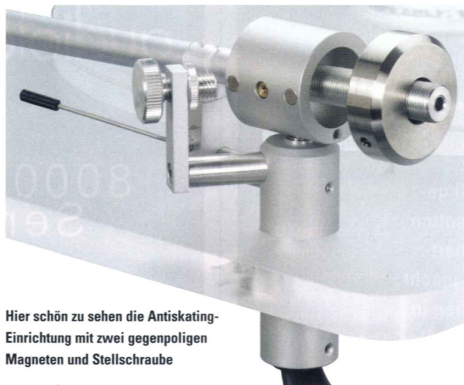
Hier schön zu sehen die Antiskating-Einrichtung mit zwei gegenpoligen Magneten und Stellschraube

inklusive Satisfy-Arm und MM-System Aurum Classic Woods rund 870 Euro. Dazu kommt mit zirka 320 Euro der Ausnahme-Verstärker „Smartphono“ und ein hochwertiges NF-Kabel für knapp 70 Euro nebst einer praktischen Abdeckhaube, die mit etwa 100 Euro zu Buche schlägt, damit der elegante Dreher nicht zustaubt.