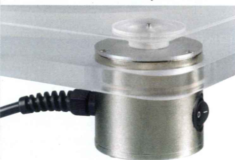
Akustisch entkoppelter Antriebsmotor in schwerem Gussgehäuse (u.). Darüber läuft der transparente Riemen