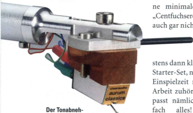
Der Tonabnehmer ist in einen Bügel geschraubt, der am Arm fixiert wird

Die dürfte auch bei diesem Angebot voll aufgehen, das, rechnet man die Einzelpreise des „Start Smart Pakets“ nur einmal grob durch, keinesfalls ein Schnäppchen ist. So kostet der Emotion