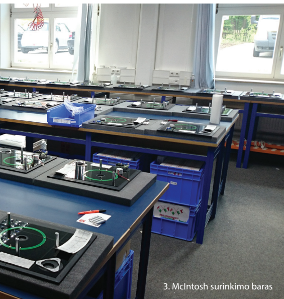
3. McIntosh surinkimo baras