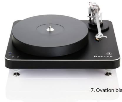
7. Ovation black