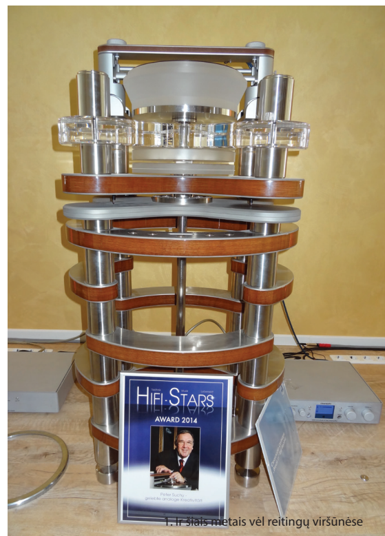
1. Ir šis metalas vėl reitingų viršūnėse