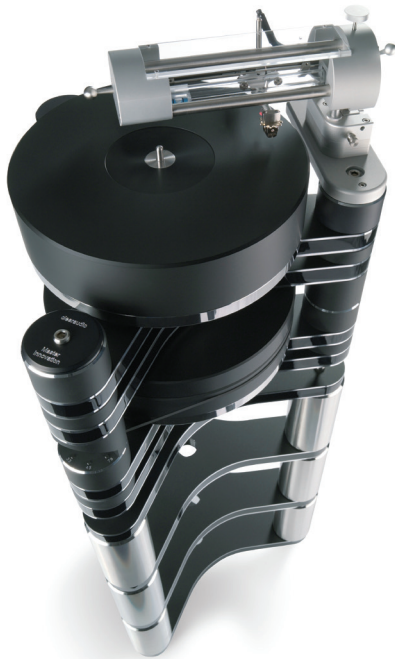
9. Master-Innovation ant stovų