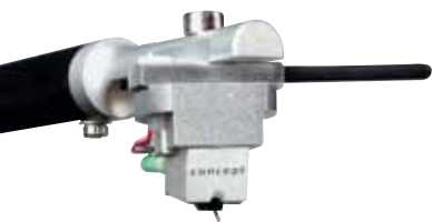
Der Abtaster folgt dem MM-Prinzip und steckt in einem massiven Metallgehäuse