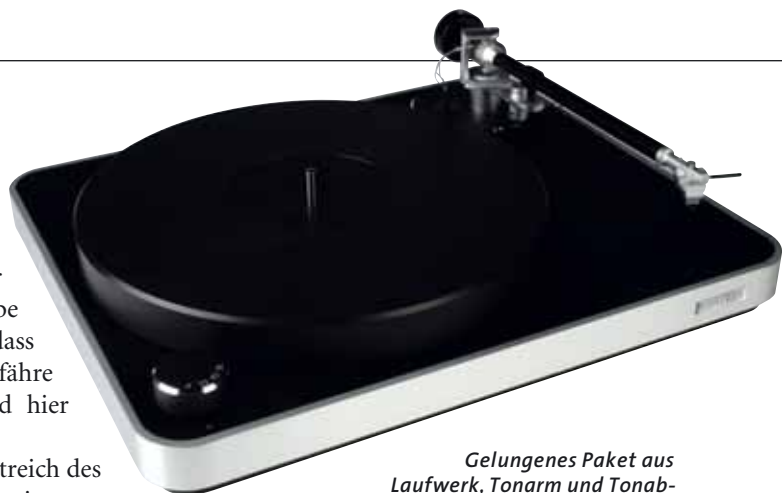
Gelungenes Paket aus Laufwerk, Tonarm und Tonabnehmer: Clearaudio hat für den Concept von Grund auf neue Komponenten entwickelt

Den „Concept“ gibt's nur als Paket. Genau so, wie er hier vor uns steht. Zargenoberfläche und Teller in Mattschwarz, außen herum läuft eine dekorative Aluminium-Zierleiste; das ist die erste erfreuliche Überraschung. Der Concept hat mal so gar nichts von einem Sparmodell, er darf vielmehr als stilistisch eigenständig und absolut gelungen gelten, oder, um es etwas deutlicher zu formulieren: Im Gegensatz zu vielen seiner Mitbewerber auch in deutlich höheren Preisklassen hat der Clearaudio etwas, das