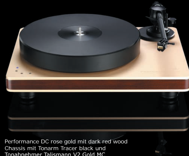
Performance DC rose gold mit dark red wood Chassis mit Tonarm Tracer black und Tonabnehmer Talismann V2 Gold MC

Performance DC rose gold with black chassis with tonearm Tracer black and cartridge Talismann V2 Gold MC