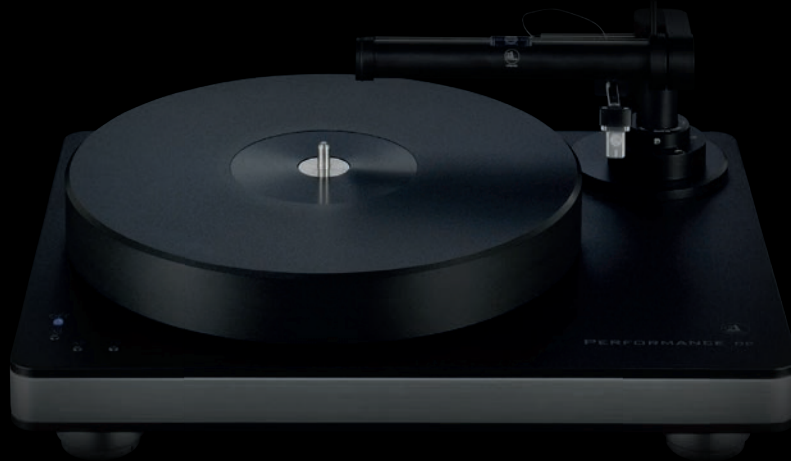
Performance DC black mit silver Chassis mit Tonarm TT5 black inkl. swing base und Tonabnehmer essence mc

Die Verschmelzung von unserem Performance DC Laufwerk, dem preisgekrönten TT5 Tangentialtonarm und unserem streng selektierten essence mc Tonabnehmer ist die klanglich unübertroffene Symbiose für höchsten Analoggenuss. Wer den Klappmechanismus von TT2 oder TT3 und damit den völlig freien Zugriff zur aufgelegten Schallplatte vermisst, für den ist die von clearaudio eigens entwickelte swing base die ideale Ergänzung zum TT5. Ausgezeichnete Abtasteigenschaften und hyperpräziser Gleichlauf sorgen bei all unseren Performance DC Kombinationen für höchsten Musikgenuss.