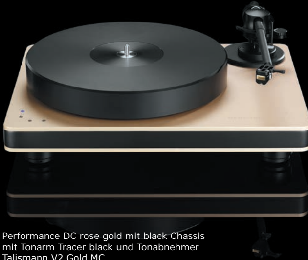
Performance DC rose gold mit black Chassis mit Tonarm Tracer black und Tonabnehmer Talismann V2 Gold MC

Maximale Stabilität bei optimaler Agilität garantiert das Tonarmrohr aus extrem verwindungsstifem Karbon. Perfekt zugänglich liegt das magnetische Antiskating in der Drehachse. Das Headshell aus Aluminium mit einstellbarem Azimuth und das Tonarmgegengewicht können ebenso leicht wie präzise justiert werden. Das neueste Highlight von clearaudio, ein Genuss für Auge und Ohr.