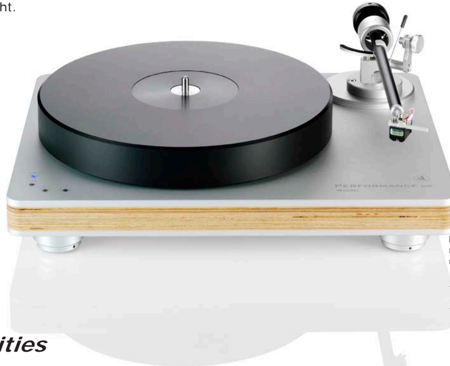
Performance DC silver mit wood Chassis mit Tonarm Satisfy Kardan Aluminium black und Tonabnehmer Talisman V2 Gold MC

Ergänzt wird dieses Paket durch den Talisman V2 Gold MC, der durch seine patentierte, völlig drehpunktsymmetrische Spulenanordnung mit acht Magneten und Golddrahtspulen Dynamik-Bestwerte erreicht.