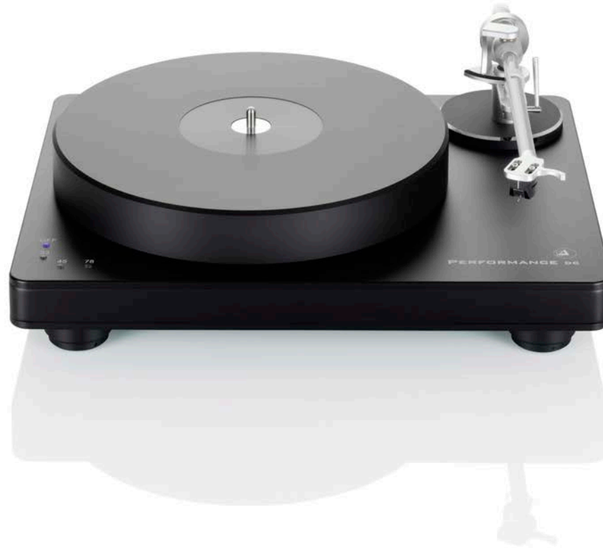
Performance DC black mit black Chassis mit Tonarm Clarify und Tonabnehmer Virtuoso V2 MM

Der Clarify Tonarm ist komplett magnetgelagert und daher absolut reibungsfrei. Die innovative clearaudio Neuentwicklung leitet auch feinste Signale absolut störungsfrei weiter und zeigt sich unbeeindruckt von Resonanzen. In Verbindung mit dem Virtuoso V2 MM Tonabnehmer ein bewährtes Paket weltweit.