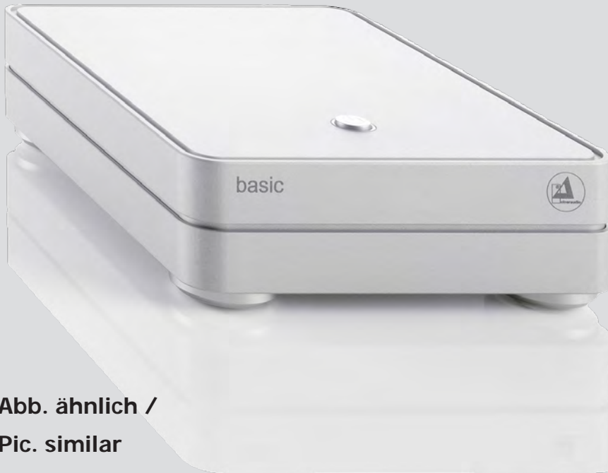
Abb. ähnlich / Pic. similar