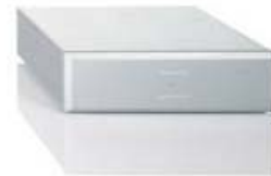
Akku-Power „+“ und Aufladegerät